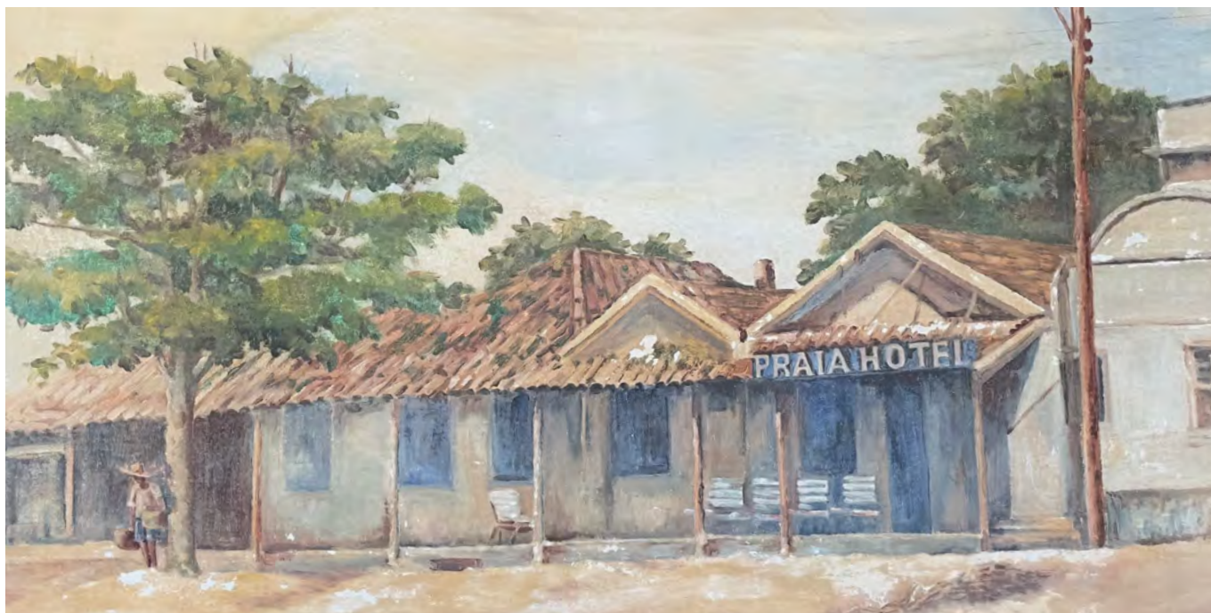
Imagem: A pintura revela como era o ambiente da Praia Central e o Hotel Praia bem no estilo “pé na areia”.