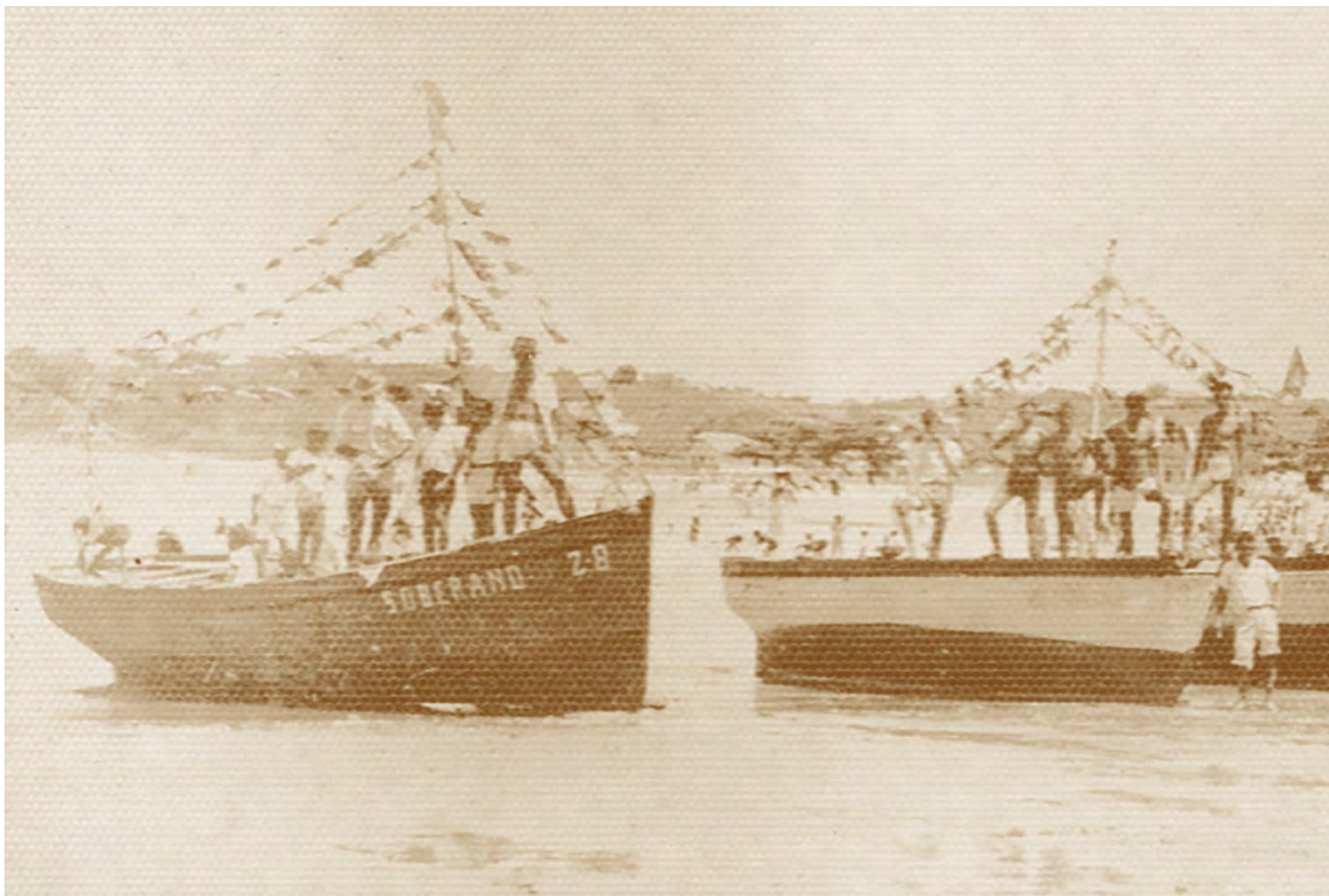
Imagem: A centenária Festa de Nossa dos Navegantes conta com a tradicional procissão e o enfeite das embarcações.