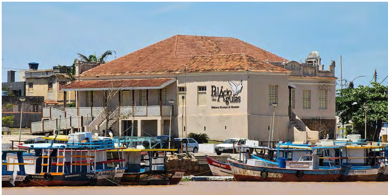
Imagem: Após reforma e restauro, o Palácio das Águas abriga a biblioteca Municipal.