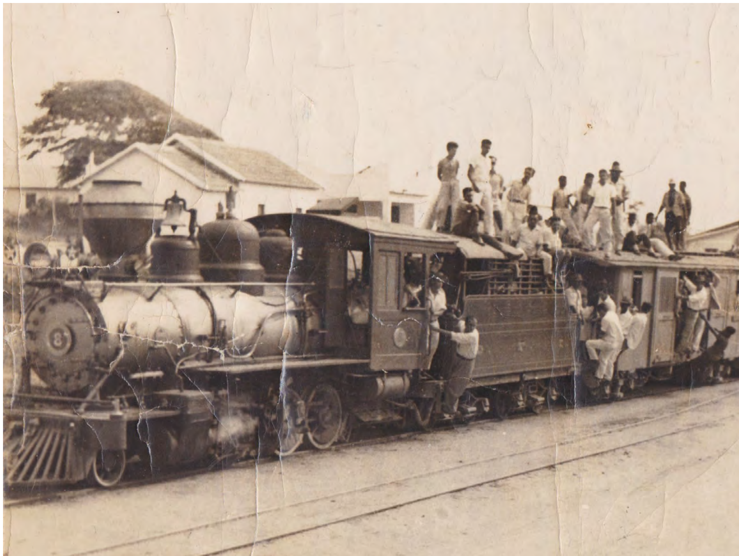
Imagem: A Estrada de Ferro Itapemirim encerrou suas operações em 1965. Alegam que este tenha sido o último trem a circular.