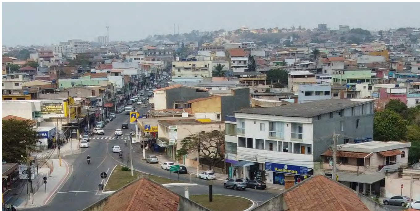
Imagem: Início do Shopping Linear. Marataízes tornou-se um importante polo comercial da região sul do Espírito Santo.

Se você adora movimento, compras e quer experimentar de tudo um pouco, este distrito combina com o seu estilo.